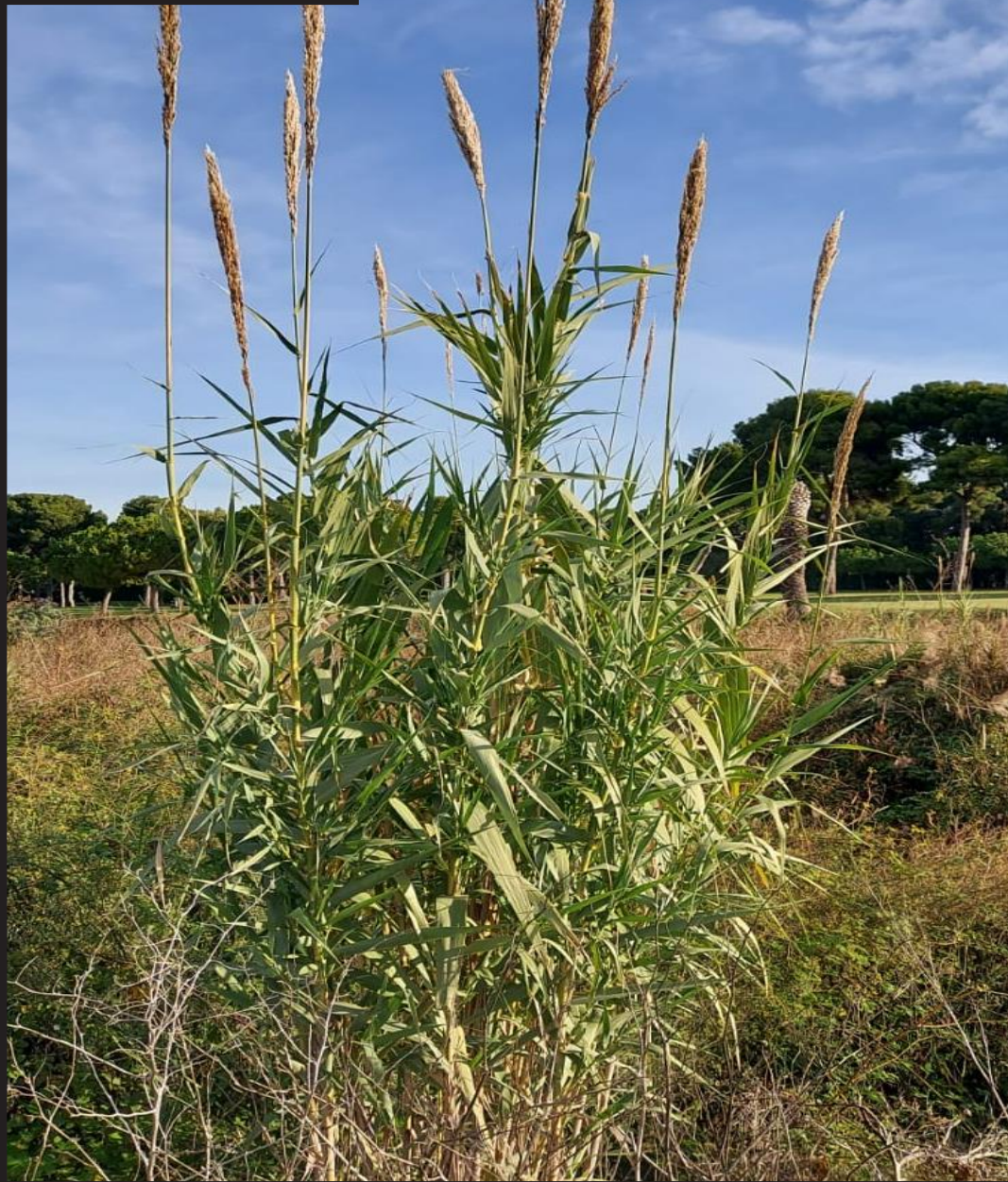
Projecte EXOGARRAF. Sensibilització ambiental i erradicació de plantes exòtiques invasores per a la conservació dels espais naturals de la costa del Garraf